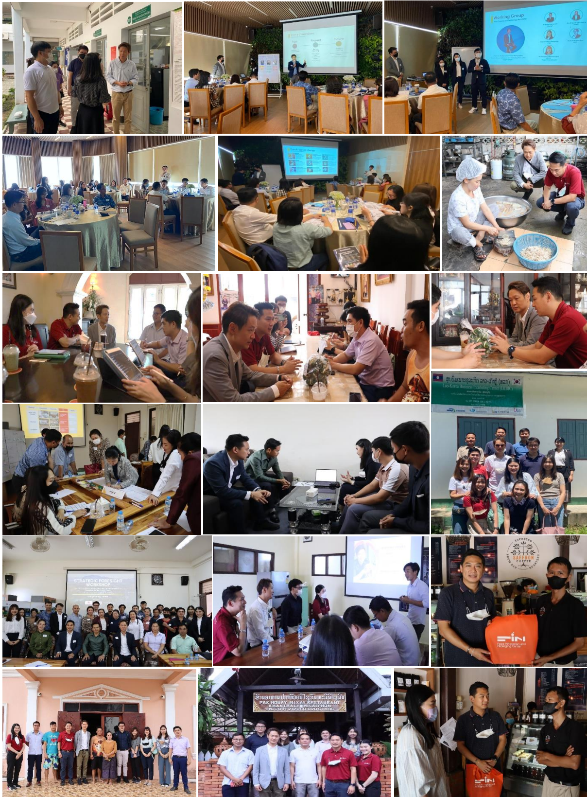
ภาพการดำเนินงาน

ลิงค์สนับสนุนโครงการ: https://prd.go.th/content/category/detail/id/39/iid/53766